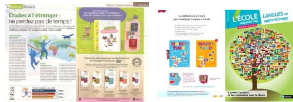
Contextualisation Famille & Education

Possibilité de contextualiser votre communication (format au choix)