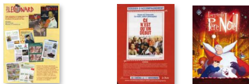
Encart Famille & Education

Une approche marketing direct efficace > géolocalisation et frais postaux réduits