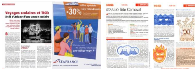
Publi-rubrique New Standpoints

Réalisé en collaboration avec la rédaction, 100 % personnalisable, possibilité de tiré à part